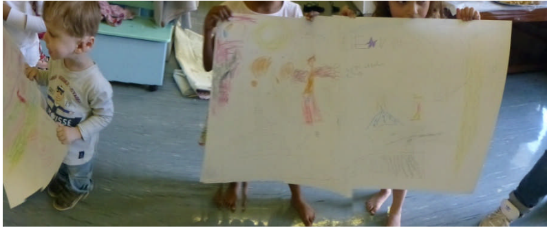
FIERE DE MONTRER LEURS TRAVAUX EN COMMUNS